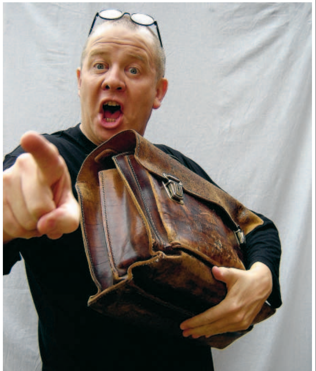
Ce Carniérois reconnaît qu'il ne pourrait pas se passer du plaisir d'investir la scène.

25 ANS DE SCÈNE Le public parisien semble réceptif à cet humour, même si le comédien a dû faire quelques aménagements à son spectacle: "Le public français rit aux mêmes endroits que les Belges. C'est rassurant. Mais j'ai raccourci la pièce car à Paris, les créneaux horaires sont très courts. Aux Feux de la rampe, le théâtre ou je joue, il y a un spec-